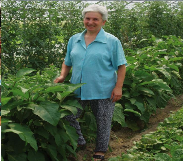
fotografia scattata del produttore e finita sul totemù da banco