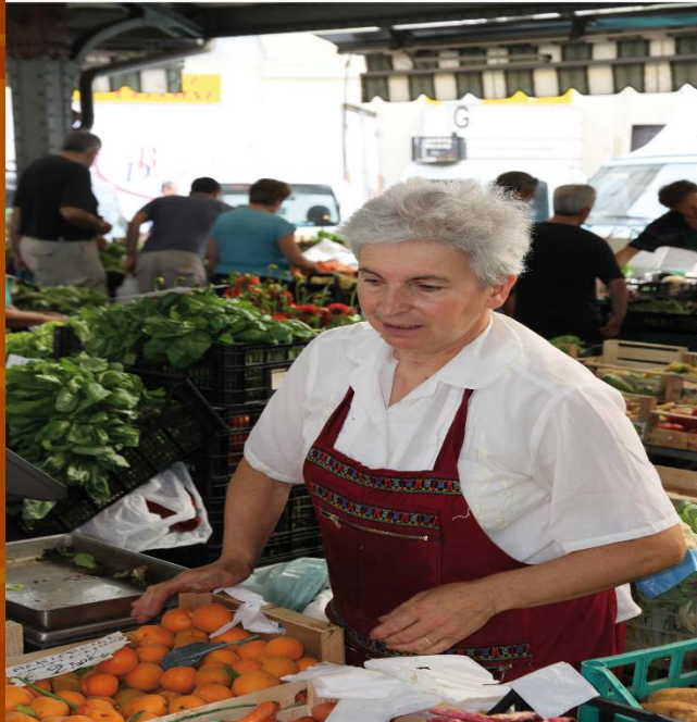
fotografia scattata durante il lavoro e finita sul pannello del sottotetto